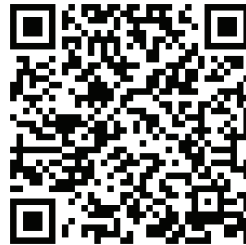
Albo On-line dei Comunicati

consultabile anche tramite dispositivo portatile scansionando il QR code qui riportato: